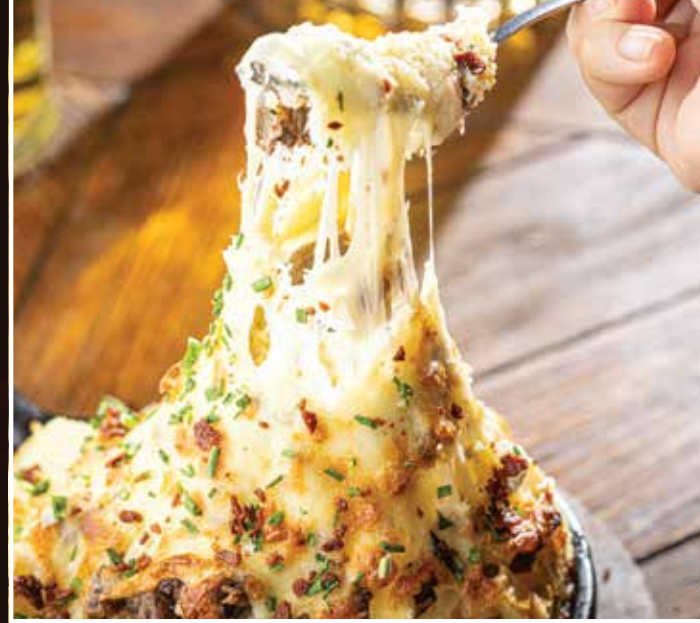
PAPA AL HORNO

Delicioso guacamole, con trozos de chicharrón de picaña (250 g)*