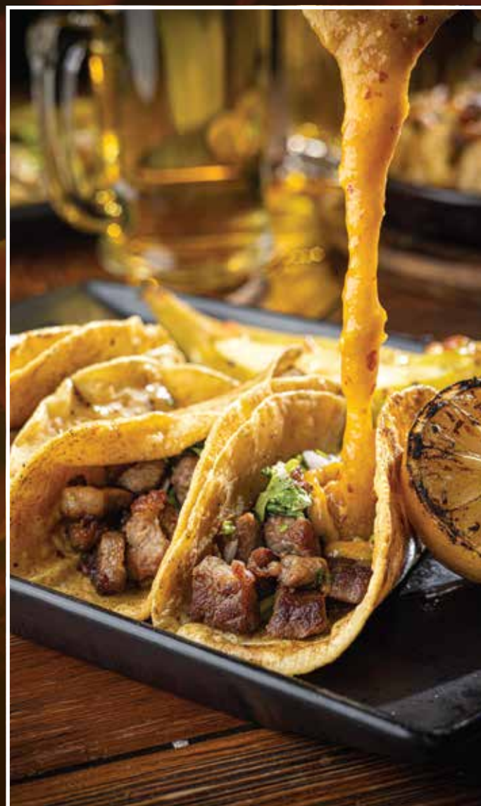
TACOS DE RIB-EYE

Tacos acompañados de un chile relleno de queso (40g)*.