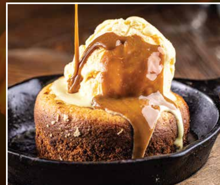
PAN DE ELOTE