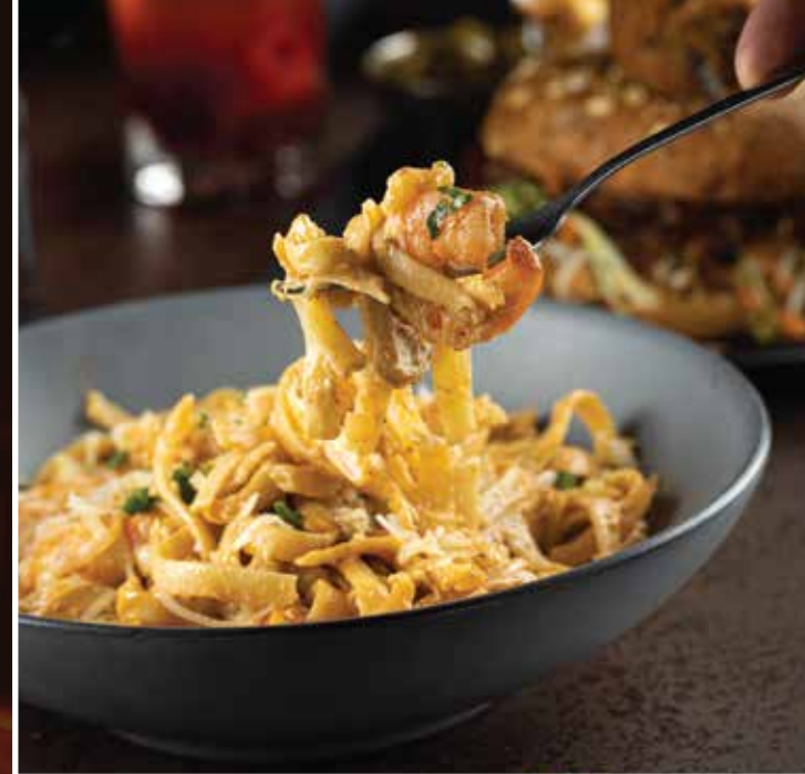
PASTA LOUISIANA CON CAMARONES

Con camarones (130g)* $269 Con pollo (200g)* $249