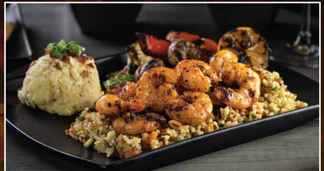
CAMARONES SAN BLAS

Filete de Salmón (220g)*, puré de papa y verduras a la parrilla