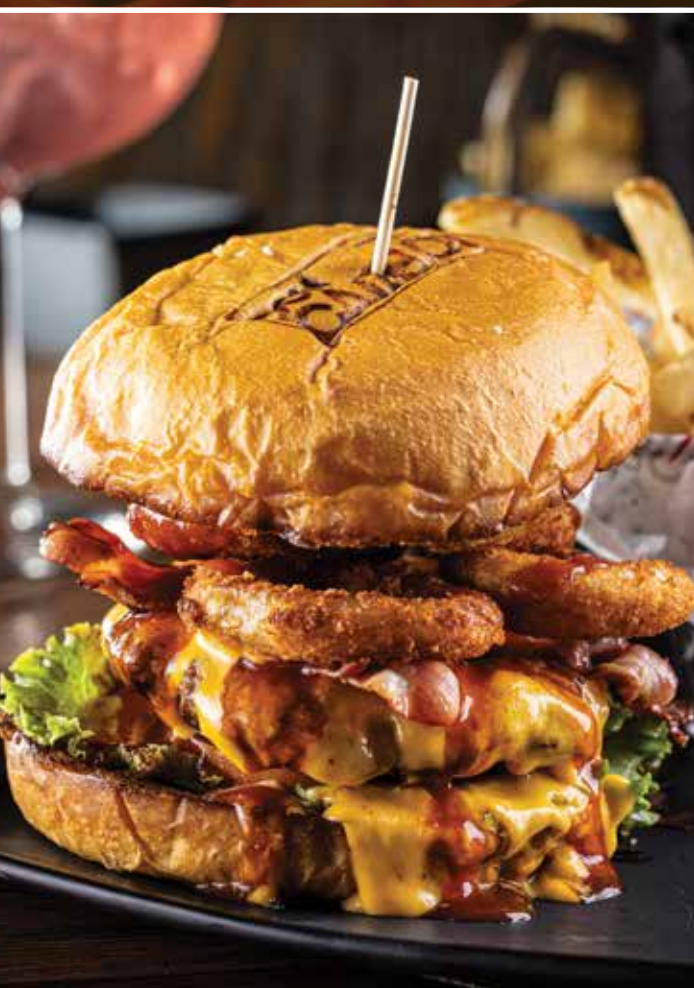
SPICY ONION BURGUER

Carne de sirloin (200g)*, aros de cebolla y bañada en queso para nachos y BBQ chipotle.