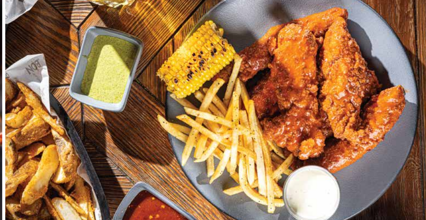
TIRAS DE POLLO EMPANIZADO