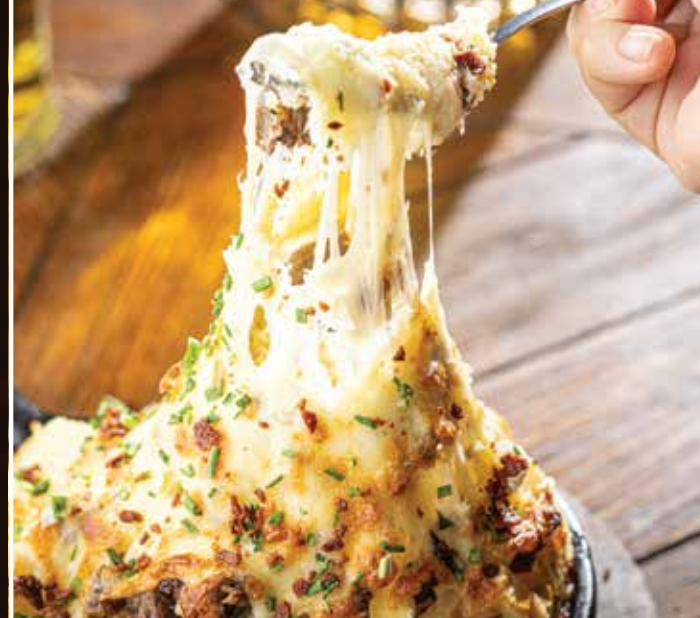
PAPA AL HORNO

Delicioso guacamole, con trozos de chicharrón de picaña (250 g)*