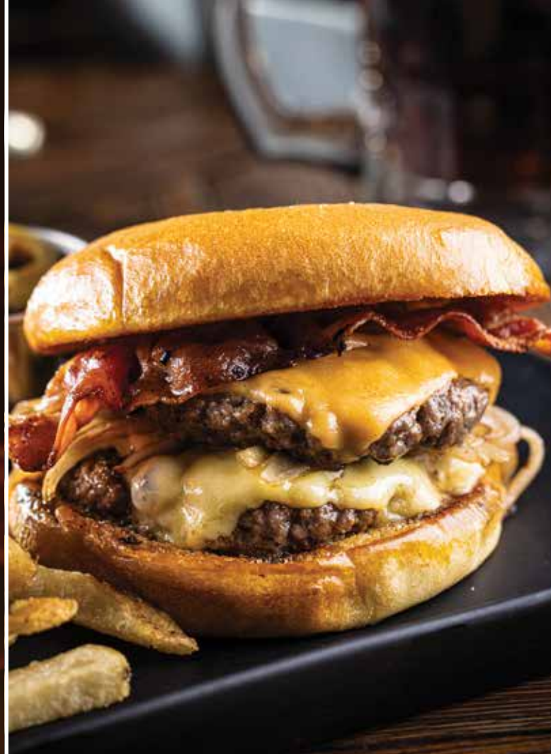
SMASH BURGUER BACON

Agrega queso y tocino $30 Agrega queso y chili $40